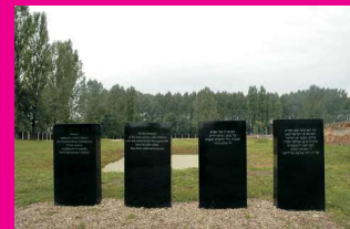
Gedenktafeln auf dem Aschenfeld in Auschwitz