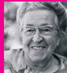
Corrie ten Boom

Ein Mann, dem man den Bart angezündet hatte, war der erste Jude, der bei der Amsterdamer Uhrmacherfamilie ten Boom Zuflucht suchte. Bald darauf baute Corrie ten Boom (1892-1983) eine Untergrundorganisation auf, die vielen Juden das Leben rettete.