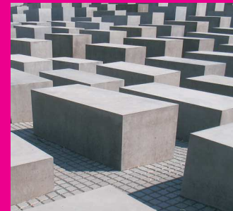
Denkmal für die ermordeten Juden Europas im Zentrum Berlins

Nicht nur in Deutschland, auch in vielen anderen europäischen Ländern, sogar in den USA und selbstverständlich in Israel finden sich Gedenkstätten für die Opfer des Nationalsozialismus. Sie sind heute häufig Bestandteil touristischer Attraktionen und formen auf einer Bildungsreise – wie andere Sehenswürdigkeiten – lediglich einen der Programmpunkte. Deshalb soll der Begriff „Denk-mal“ zum Jahrestag der Befreiung wörtlich genommen werden: Die Schüler der KGSE gestalten ihre Aufführung mit Lyrischen Texten von Rose Ausländer, Else Lasker-Schüler und Mascha Kaleko und geben Zeugnis von dem erfahrenen Leid, der Ausgrenzung, der Verfolgung, der Vernichtung. Die Melodie des israelischen Liedes „Shalom Chaverim“ untermauert die Aussagen der Gedichte und wird zum Abschluss von allen gemeinsam intoniert.