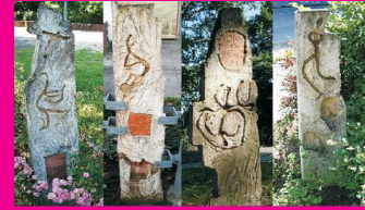
Viele Stelen aus Beton und Ton erinnern an Stationen des Todesmarsches in Holstein

Die SchülerInnen der Elsa-Brändström-Schule erinnern an den Todesmarsch von 5000 KZ-Insassen, der am 16. Januar 1945 in Auschwitz-Fürstengrube begann und ab dem 13. April für eine Gruppe von 500 KZ-Häftlingen von Lübeck durch ostholsteinische Dörfer auf die „Cap Arcona“ im Neustädter Hafen führte. Am 3. Mai bombardierten und versenkten britische Flieger das mit Hunderten Menschen angefüllte Schiff.